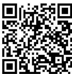
Figura 5. Código QR que dirige a Tabla de Especificaciones desglosada

Nota: Se puede acceder a la tabla de manera alternativa a través del siguiente vínculo; https://sites.google.com/view/jr-y-ods16-kna/inicio